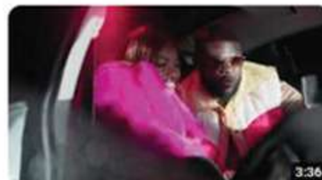
Sugar Kavar - Onisayé (Clip Officiel)