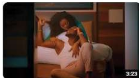
Sugar Kavar - Jada (Clip Officiel)