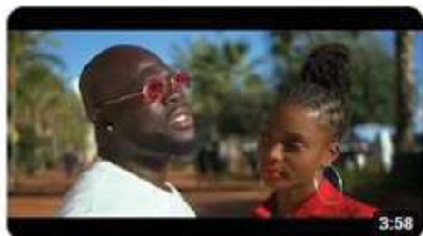
Sugar Kavar - C'était Écrit feat. Ronald Rubinel (Clip Officiel)