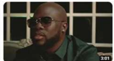
Sugar Kavar - Maoney (Clip Officiel)